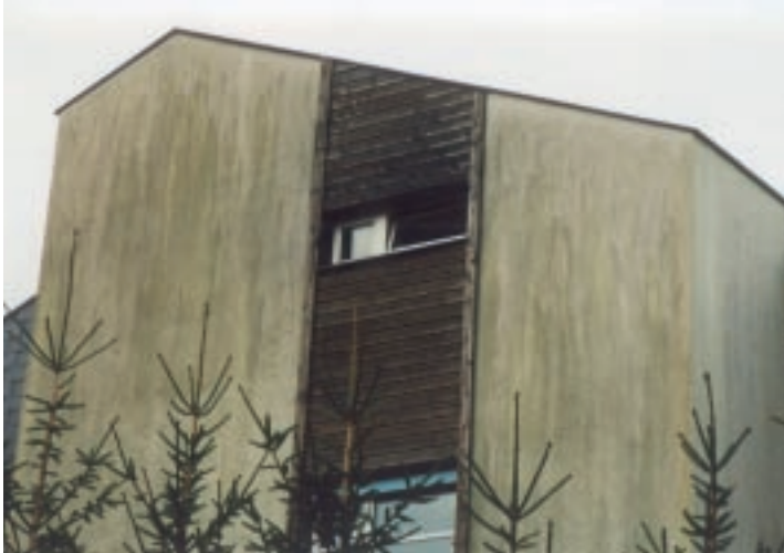
1 Die für Algen typische Streifenform. Der ganz schmale Streifen unterhalb des Dachrandes ist geschützt, trocken und frei von mikrobiellem Befall.