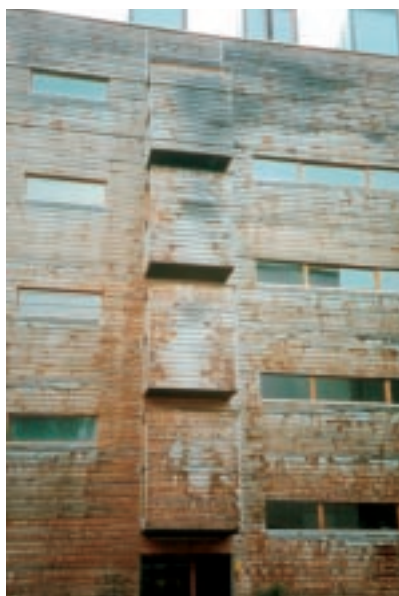
6 Auch Holzfassaden brauchen Witterungsschutz!

bauer (Stuckateure), aber auch die Produkt- und Systemhersteller verfügen über ausreichende Fachkenntnisse und Erfahrung, und nur diese haben auch das fachlich-informative Hintergrundwissen aus Fachzeitschriften, Fortbildungsveranstaltungen und Diskussionen, dass an neuzeitlichen Bauweisen mikrobielle Schäden auftreten können – sofern diese erheblichen Befeuchtungen ausgesetzt sind. Selbst den zahlreichen Energiesparberatern der unterschiedlichsten Organisationen sind diese Probleme nicht unbekannt. All die Genannten haben eine eindeutige Aufklärungs-, Prüf-, Warn- und Hinweispflicht gegenüber dem jeweiligen Auftraggeber.